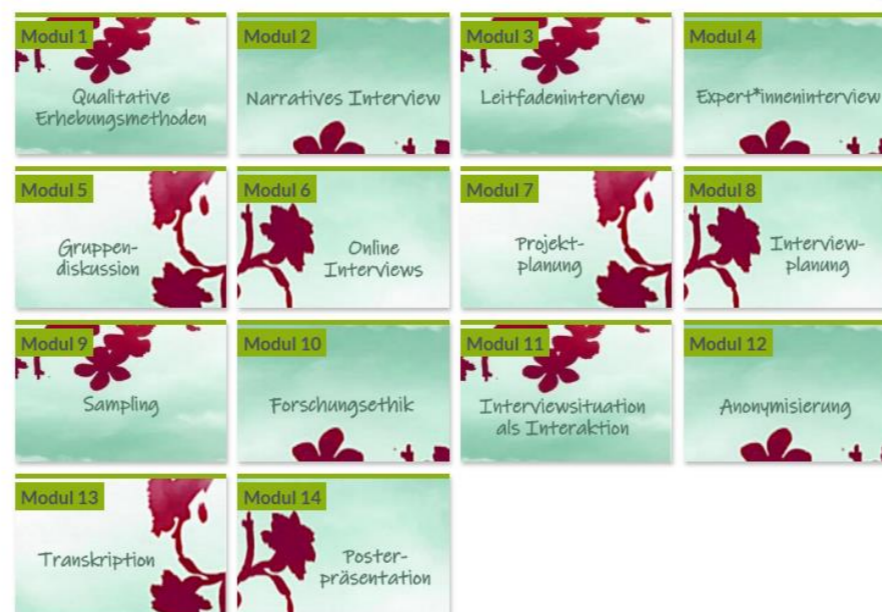
Abb. 2: Übersicht aller Kursmodule

Der eLearning-Kurs „Qualitative Erhebungsmethoden“ behandelt in vierzehn Modulen verschiedene thematische Aspekte qualitativer Datenerhebung. Ein Schwerpunkt liegt dabei auf qualitativer Interviewforschung.