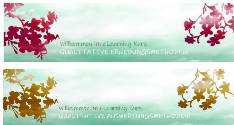
Abb. 1: Kursangebot zu qualitativen Methoden

Das eLearning-Angebot ergänzt den bereits etablierten Kurs zu „ Qualitativen Auswertungsmethoden “. Dieser behandelt klassische Ansätze der qualitativen Auswertungsmethoden wie die Grounded Theory Methodologie, die Narrationsanalyse, die Objektive Hermeneutik und die Dokumentarischen Methode. Dieser Kurs vermittelt den Studierenden bereits umfassende Techniken zur Analyse qualitativer Daten.